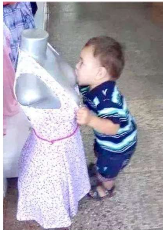
Hopsz! Apró tévedés, avagy mikor még hisznek a csodákban:-)