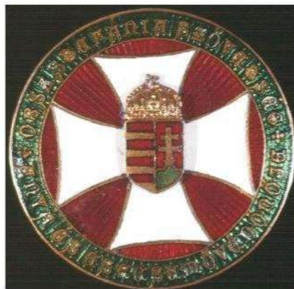
Őr Mária védőnő

Hungarikum Bizottság 2015. április 23-i döntése alapján az idén 100 éves Magyar Védőnői Szolgálat, mint nemzetközileg is egyedülálló, tradicionális ellátási rendszer mától szintén nemzeti büszkeségeink között tudható.