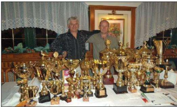
2011. évi nyereményeink